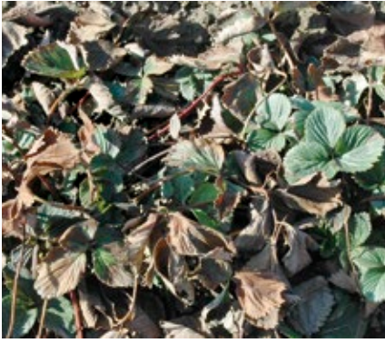
Erdbeerpflanzen vor ...