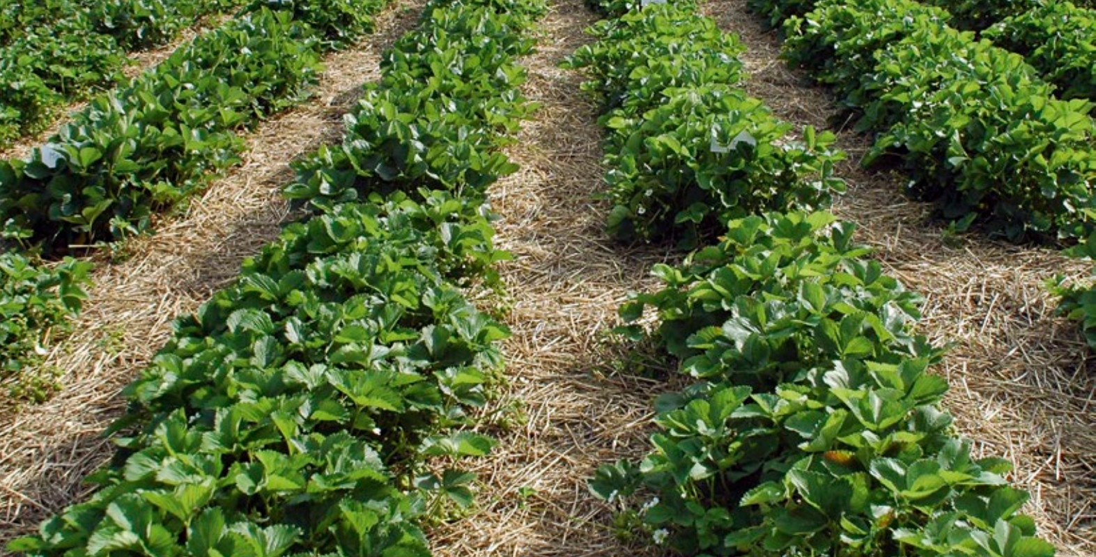
Saubere Erdbeerfrüchte durch Einlegen von Stroh