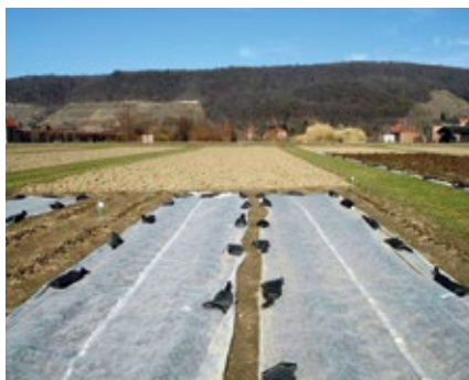
Ernteverfrüfung durch flache Abdeckung mit Vlies