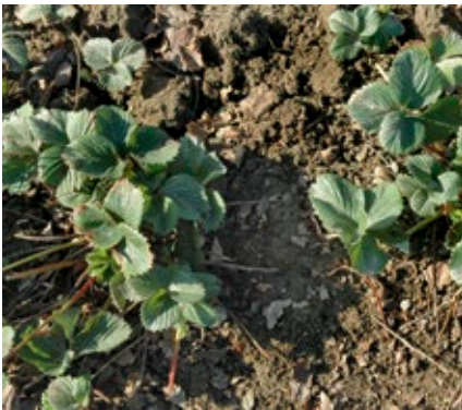
... und nach der Entfernung des alten Laubes im März

Eine Voraussetzung für einen hohen Ertrag im Folgejahr ist eine frühzeitige Pflanzung. Werden Grünpflanzen für die Pflanzung verwendet, so ist der günstigste Pflanzzeitpunkt für Erdbeeren Ende Juli. Je später die Pflanzung erfolgt, desto geringer ist der Ertrag im Folgejahr. Vor der Pflanzung muss eine sorgfältige Bodenvorbereitung erfolgen. Zum Pflanztermin muss der Boden abgesetzt sein. Zur Pflanzung sollten die Jungpflanzen mindestens drei Blätter besitzen und kräftig bewurzelt sein. Bei der Pflanzung ist auf die richtige Pflanztiefe zu achten. Pflanzt man zu tief und das Herz ist teilweise mit Erde überdeckt, entwickeln sich die Pflanzen zögernd. Zu hoch gepflanzte Jungpflanzen sind austrocknungsgefährdet. Bei Erdbeeren sind verschiedene Pflanzsysteme möglich. Im Garten sollte man jedoch die Einzelreihe gegenüber der Doppelreihe bevorzugen. Einzelreihen werden besser durchlüftet, sodass der Befallsdruck mit pilzlichen Schaderregern geringer ist. Die Pflege der Einzelreihen ist auch leichter. Der Abstand zwischen den Erdbeerreihen beträgt je nach dem Wuchsverhalten der Sorte 0,60 m bis 0,80 m, der Abstand von Pflanze zu Pflanze in der Reihe 0,25 m bis 0,35 m.