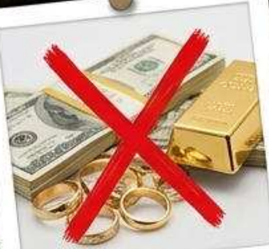
Bargeld, Schmuck & Edelmetalle.

Die Faustregel: Alles, was extrem wertvoll ist oder nicht direkt der "Gartenbewirtschaftung" dient, ist ausgeschlossen und gehört in Ihre private Hausratversicherung .