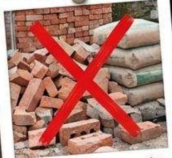
Baustoffe & separate Nebengebäude.