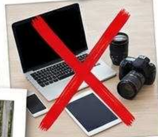
Laptops, Handys, Kameras & Tablets.