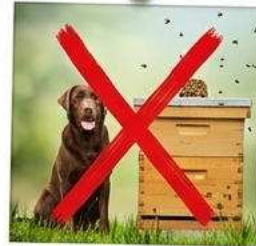
Tiere (inklusive Bienen & Völker).