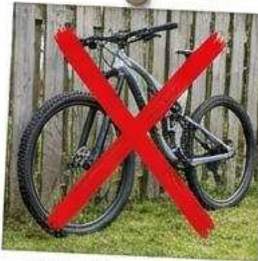
Fahrräder, E-Bikes, Autos & Anhänger.