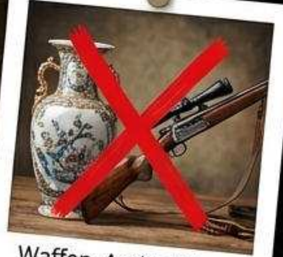
Waffen, Antiquitäten, Fremdeigentum.