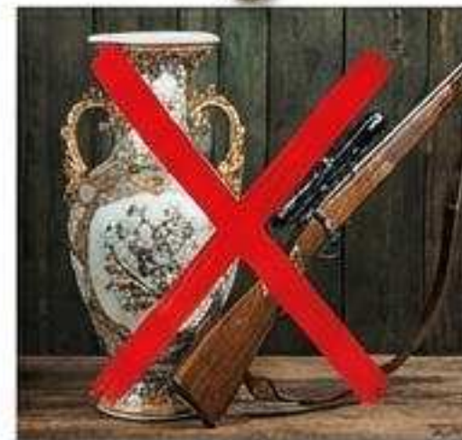
Waffen, Antiquitäten, Fremdeigentum.